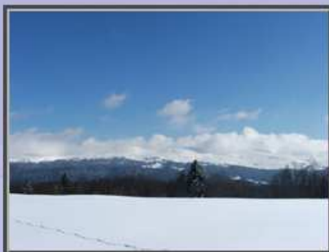
Monts du Jura à 5 h de Paris et 1 h 30 de Lyon

Depuis Paris : prendre la A 36 , puis la A39 , sortir à POLIGNY , puis suivre la direction de GENEVE jusqu'aux ROUSSES et ensuite la direction de SAINT CLAUDE.